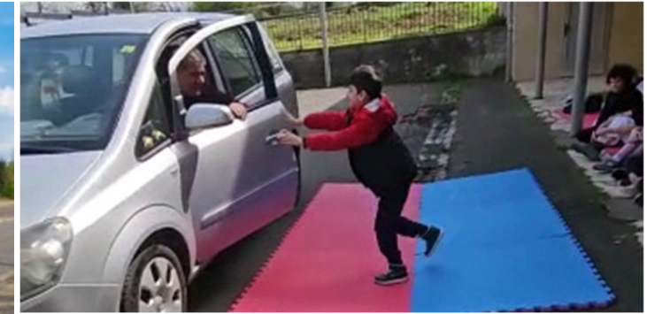
Unbekannter spricht Kind am Aartalsee an - Zeugen gesucht Web12. Sept. 2023 · Unbekannter spricht Kind am Aartalsee an Zeugen gesucht 12.09.2023, 12:04 Uhr Polizei sucht Zeugen Unbekannter spricht Kind am Aartalsee an Lahn-Dill ...